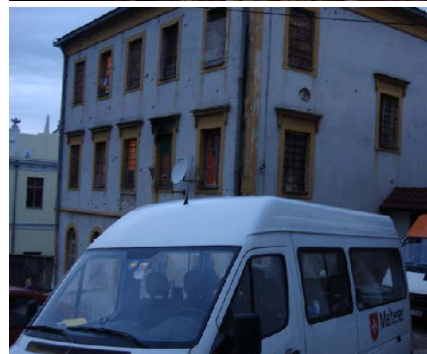
Bosnien... Land nach grausamen Krieg auf dem Weg in eine ungewisse Zukunft.