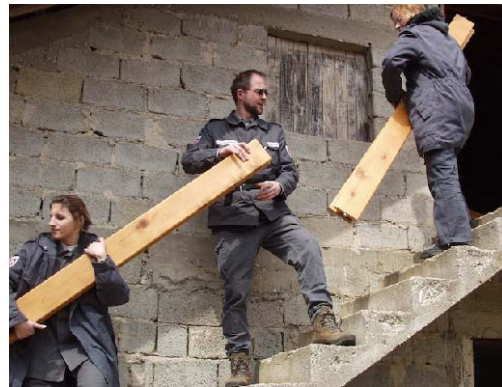
Aufbauhilfe im Bürgerkriegsland