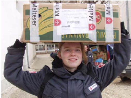
Junge Leute engagieren sich für Osteuropa....